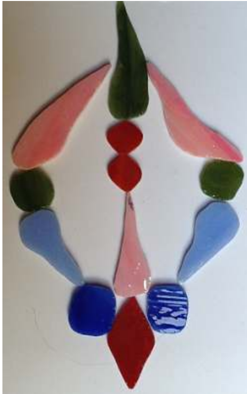
Diese Form soll es annehmen!