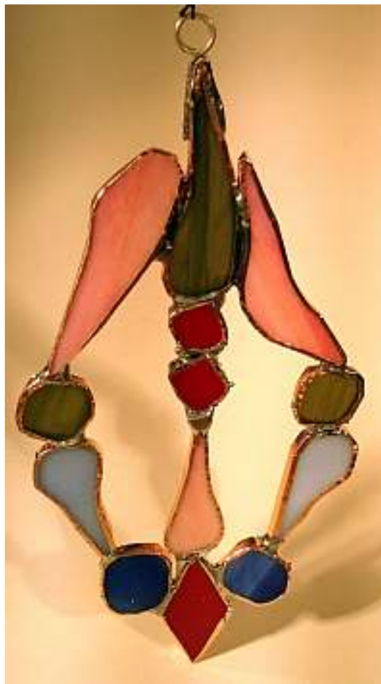
Eine Öse aus Silberdraht wird angelötet.