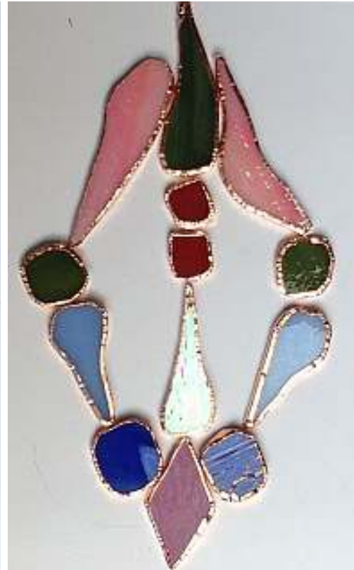
Die Glasstücke werden mit Kupferfolie versehen.