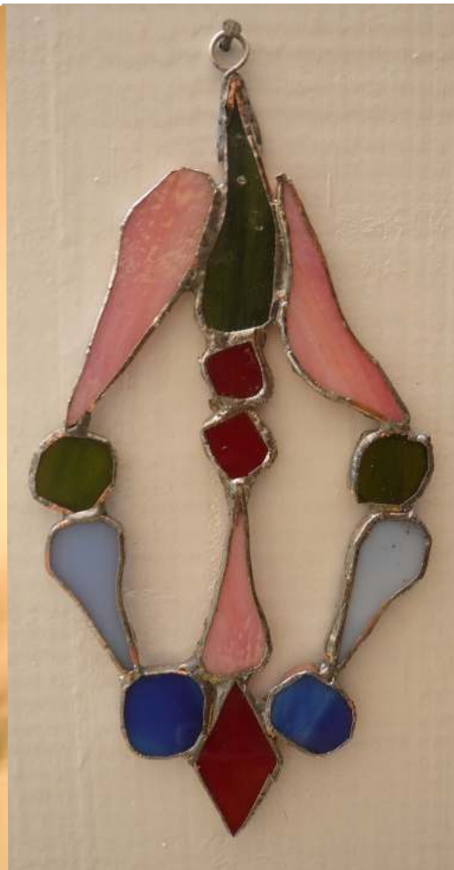
Die Kupferfolie wird verzinnt.