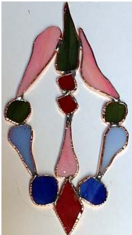
Zuerst werden die Glasstücke nur punktförmig miteinander verlötet.